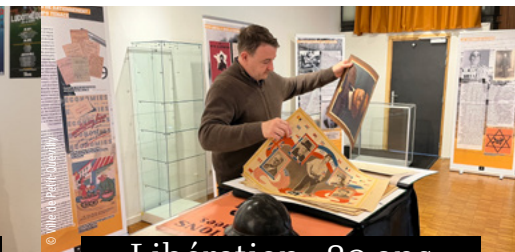
Libération : 80 ans