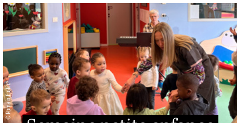
Semaine petite enfance